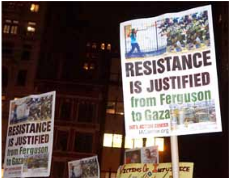
“La resistencia se justifica, de Ferguson a Gaza” Protestas por Ferguson, NY, nov. 25 2014

El 12 de enero de 2015 marcó el quinto aniversario del terremoto devastador que dejó aproximadamente 316,000 personas muertas; más de 300,000 heridos y cerca de 1.5 millones de personas desplazadas. Desde aquel entonces, el pueblo haitiano ha mantenido su resistencia firme en contra de la ocupación internacional militar e inversión neoliberal.