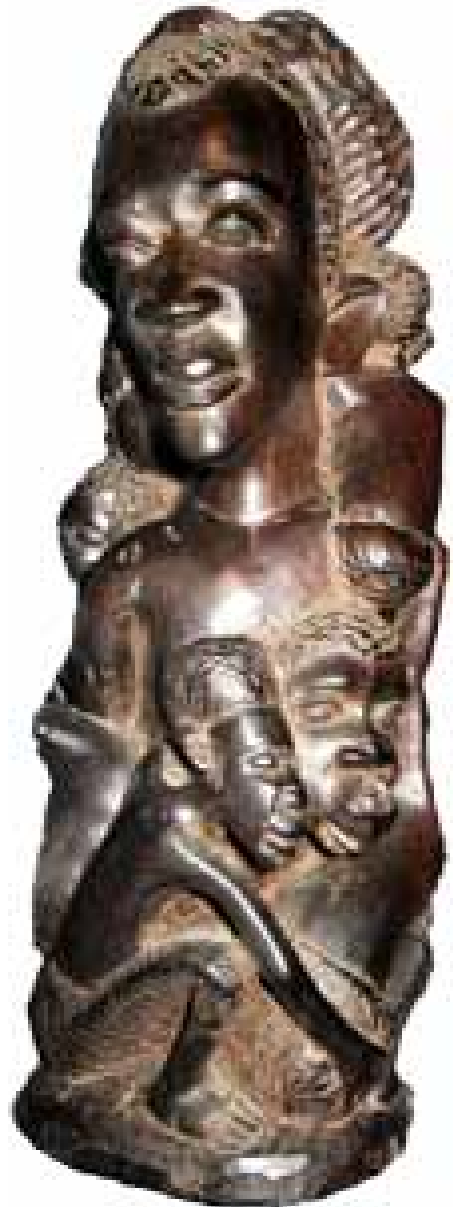
Makonde, escultura moderna en ébano

¿Cuáles fueron las estrategias ancestrales para que los diablos danzantes, bajo la imposición del cuerpo de