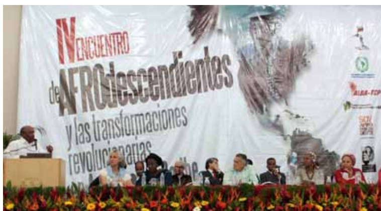
Correo del Orinoco

greso del Quibdo y en la Cumbre de Alcaldes y Dignatarios de África y la Diáspora (celebrada en Cali y Cartagena en septiembre del 2013), además de sus consignas contra el racismo, defendió el plan neoliberal de la Alianza del Pacífico y su locomotora de desarrollo a través de la gran minería que, junto con el conflicto armado, es una de las fuentes generadoras de los 5 millones de desplazados en Colombia. En contraste, los consejos comunitarios y los programas de las organizaciones de movimiento social (como el Proceso de Comunidades Negras y CONAFRO) rechazan los megaproyectos neoliberales, denuncian la apropiación de territorios ancestrales por actores armados, y promueven autonomías locales para el autogobierno y la producción ecológica sustentable en aras de la soberanía alimentaria.